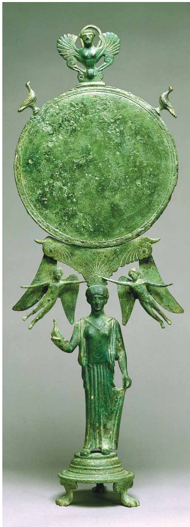
Бронзове дзеркало з ручкою у вигляді каріатиди, бл. 460 до н.е.