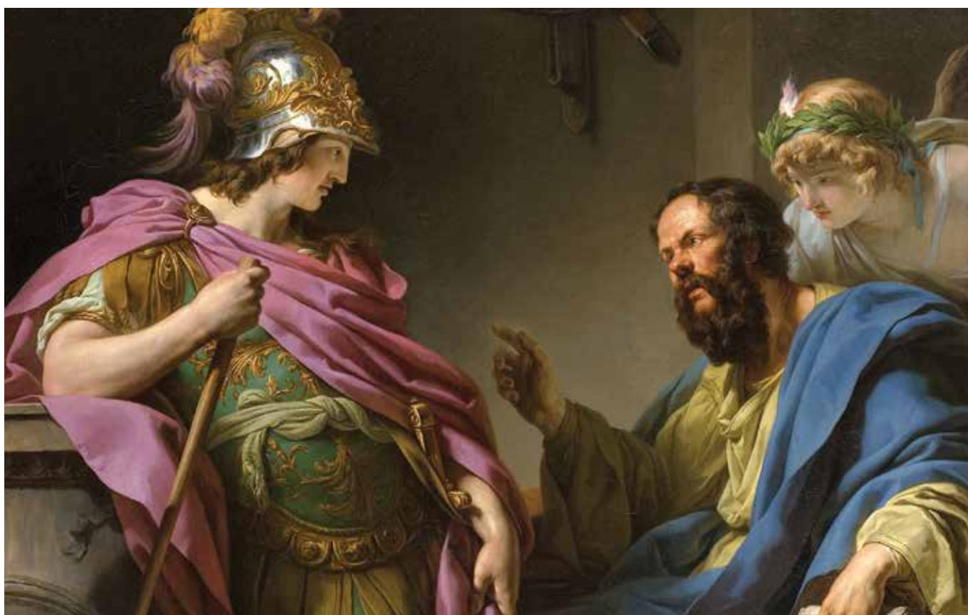
«Алквіад навчається у Сократа», 1776 р., Франсуа-Андре Венсан, Музей Фабра

Та історичний Алквіад таким не став. Бажаючи швидкої слави, він керувався своєю вигодою, змінював табори, за які воював, і цим на віки набув неслави як зрадник Афін. Платон про це знав, коли писав свій діалог, бо на той час Алквіад уже помер. Чому ж тоді великий майстер діалогу зберігає в тисячоліттях цю розмову, яка, можна сказати, була марною? Чи не для того, можливо, щоби люди побачили: ми маємо шанс, ми можемо розкрити себе для себе, розкрити справжню суть речей і завдяки цьому прожити життя мудріше, але правда і в тому, що не обов'язково ми цей шанс використовуємо. Наша історія життя може мати і безславний кінець, якщо ми, як Алквіад, у важливих виборах спокушаємося на швидкі результати заради своєї вигоди. Сократ же показує інший шлях – складніший і на перший погляд не такий яскравий, але, схоже, тільки він веде до справжнього розквіту й успіху людини – шлях самопізнання. ■